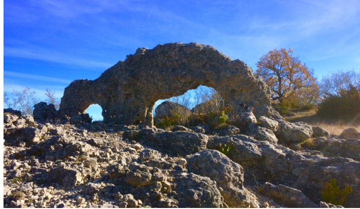
Combefere 25 octobre